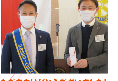
須田会員、卓話いただきありがとうございました!