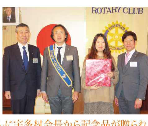
修さんに宇多村会長から記念品が贈られました。