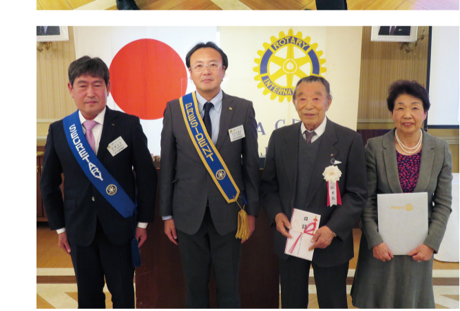
武重会員に目録を贈呈いたしました。