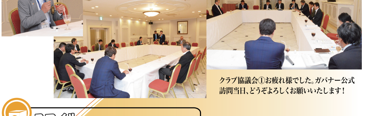
クラブ協議会①お疲れ様でした。ガバナー公式訪問当日、どうぞよろしくお願いいたします!