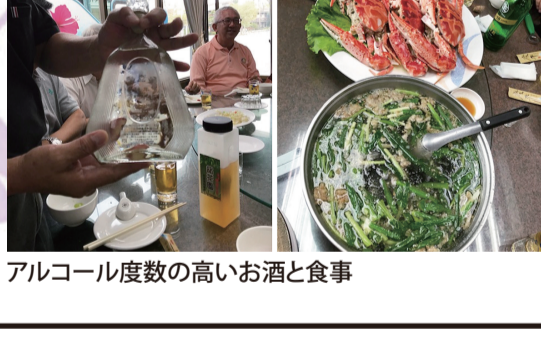
アルコール度数の高いお酒と食事