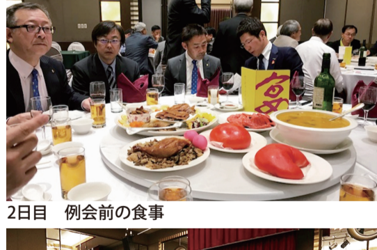
2日目 例会前の食事