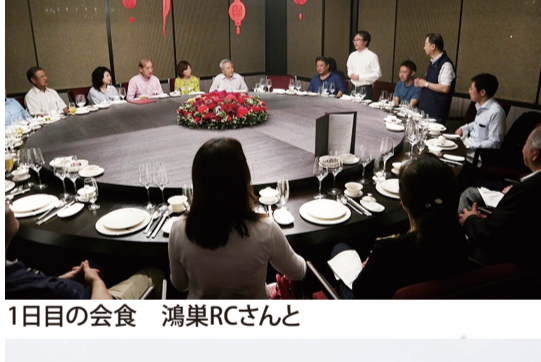
1日目の会食 鴻巣RCさんと