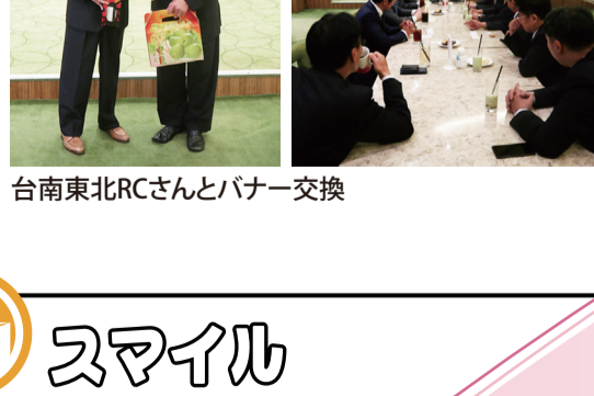
台南東北RCさんとバナー交換