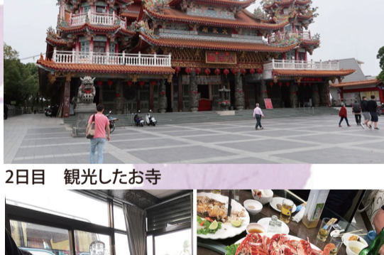
2日目 観光したお寺