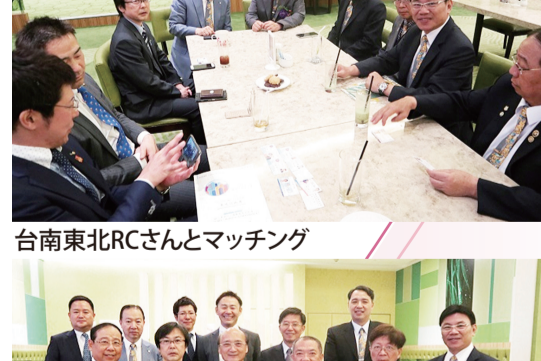
台南東北RCさんとマッチング