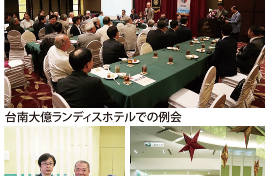
台南大億ランディスホテルでの例会