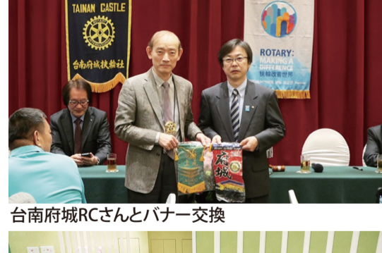
台南府城RCさんとバナー交換