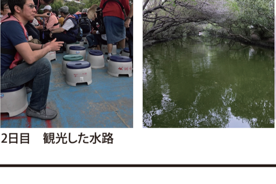
2日目 観光した水路