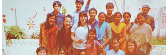
かものほしプロジェクト様、貴重なお話しを披露いただきありがとうございました！