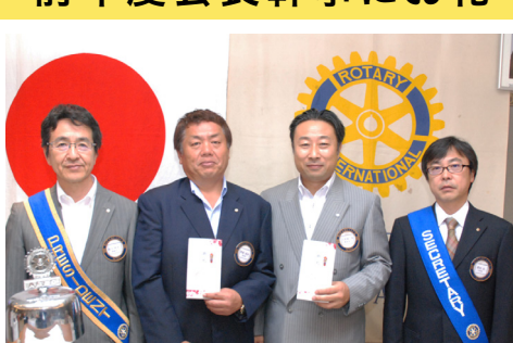
1年間お疲れ様でした!