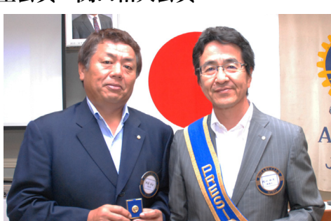
前年度会長幹事にお礼