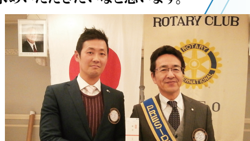
横山会員 素敵なお花と卓話 ありがとうございました。