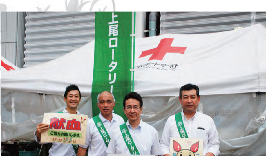
8月1日(木)、上尾駅東口 まるひろ前で、献血のお願いを行いました。ご参加・ご協力をいただきました皆様、ありがとうございました。

充填および未充填職業分類表を見ながら未充填の分野で、会員増強について話し合いを実施しました。このような話を定期的に設けて、会員増強につなげたいと思います。本日はありがとうございました。