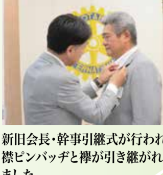
新旧会長・幹事引継式が行われ、襟ピンバッジと櫛が引き継がれました。