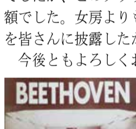
写真上：記念レコード