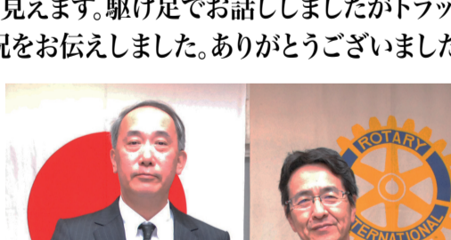
野瀬会員、卓話、ありがとうございました!

最後にUDトラックの新社屋を建てました。富士山がよく見えます。駆け足でお話ししましたがトラック業界の現況をお伝えしました。ありがとうございます。