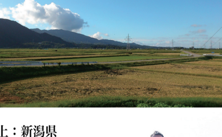
写真上：新潟県産地風景