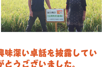
写真下：生産者さんと